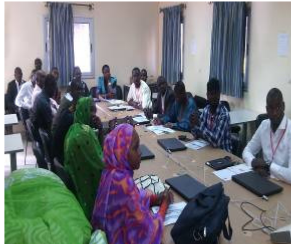
B : Apprenants en salle de travaux dirigés