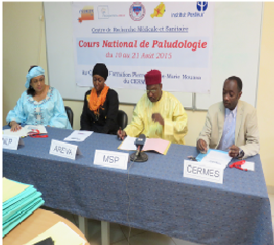
A : Cérémonie d'ouverture CNP/ 2015