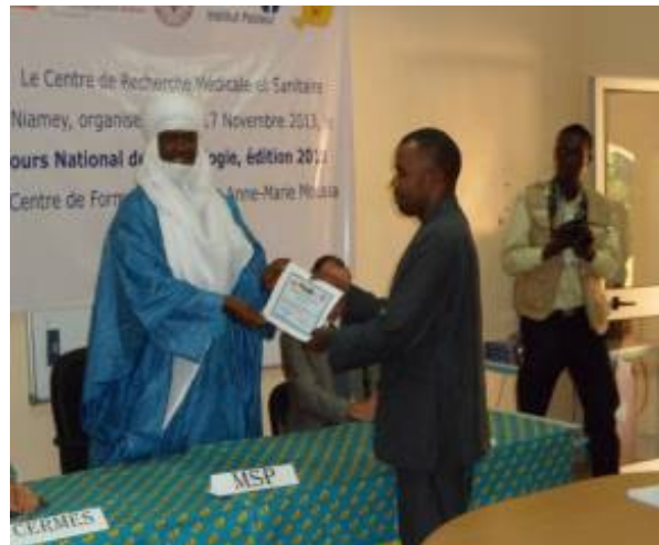
D : Remise de certificat par le ministre de la santé

Figure 1 : Organisation du Cours National sur le Paludisme au Niger