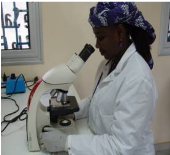
C : Salle de travaux pratique