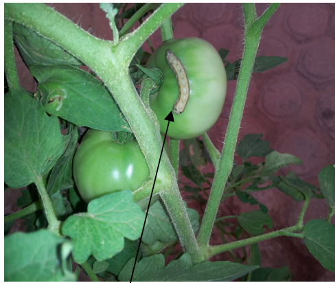
Photo 1 : larve de Helicoverpa armigera sur une tomate (TRAORE. 2013)