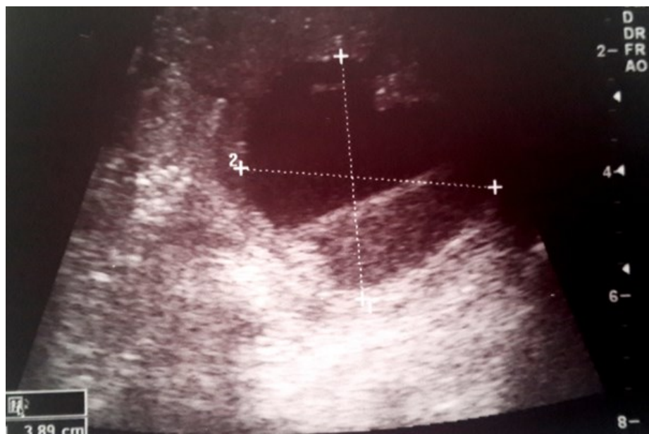
Figure 1: Coupe échographique objectivant en mediosplénique une image liquidienne à contours irrégulier et à contenu échogène