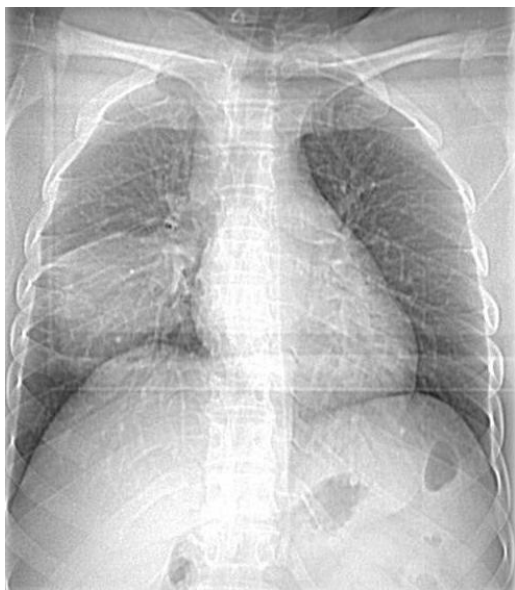
Figure 1: Radio thorax: opacité LIDt de contours flous à limite supérieur scissurale nette