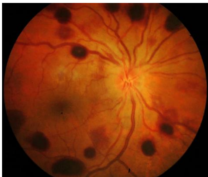
Figure 1: Photographie du fond d'œil droit montrant de multiples hémorragies pré-rétiniennes rondes à centre blanc localisées au pôle postérieur et en moyenne périphérie et un œdème papillaire