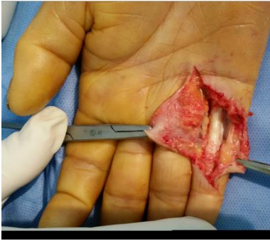
Figure 4: Aspect du canal digital après exérèse tumorale