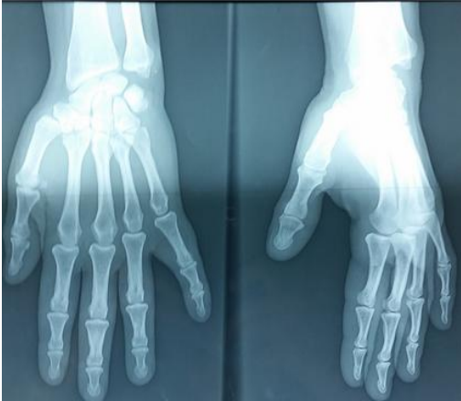
Figure 1: Image radiologique de la main de la patiente