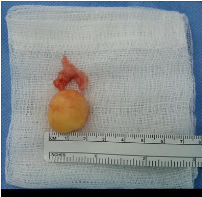
Figure 5: Tumeur excisée et ses dimensions