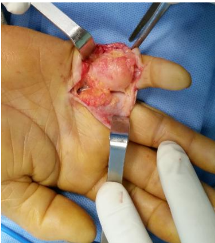
Figure 3: Aspect de la tumeur au cours de l'opération