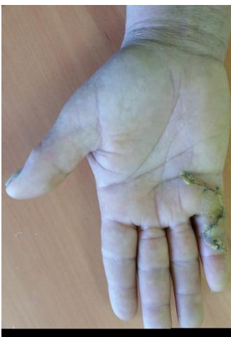
Figure 6: Aspect évolutif à deux semaines