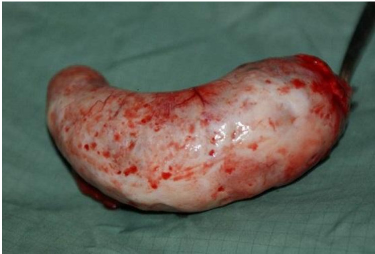
Figure 3: Pièce opératoire (vue de face, Dimensions : 153 mm x 64 mm)