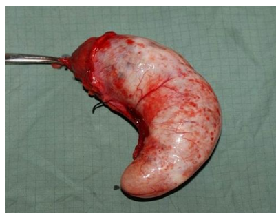
Figure 2: Pièce opératoire (vue de profil)