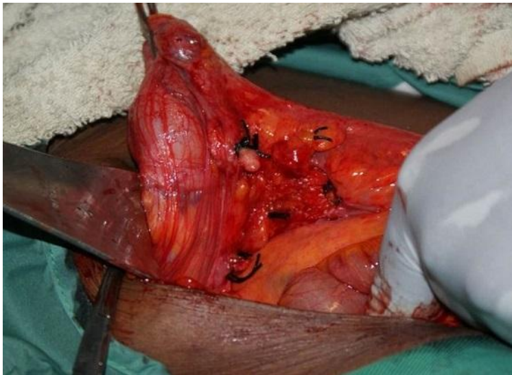
Figure 4: Vue opératoire (après appendicectomie)