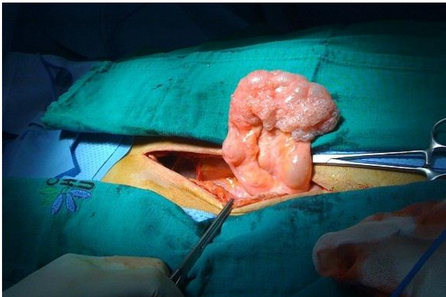
Figure 2: image per opératoire montrant la pneumatose kystique intestinale