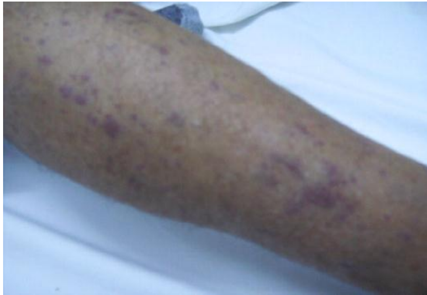
Figure 1: Lésions cutanées peu infiltrées et érythémato-violacées papuleuses des jambes accompagnant les poussées de FMF chez notre patient