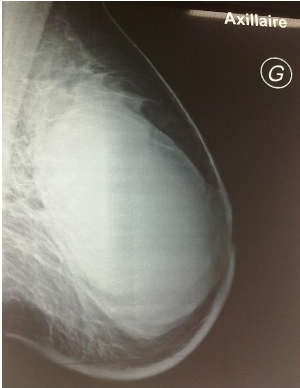
Figure 2 Mammographie du sein gauche montrant une importante opacité de tonalité hydrique