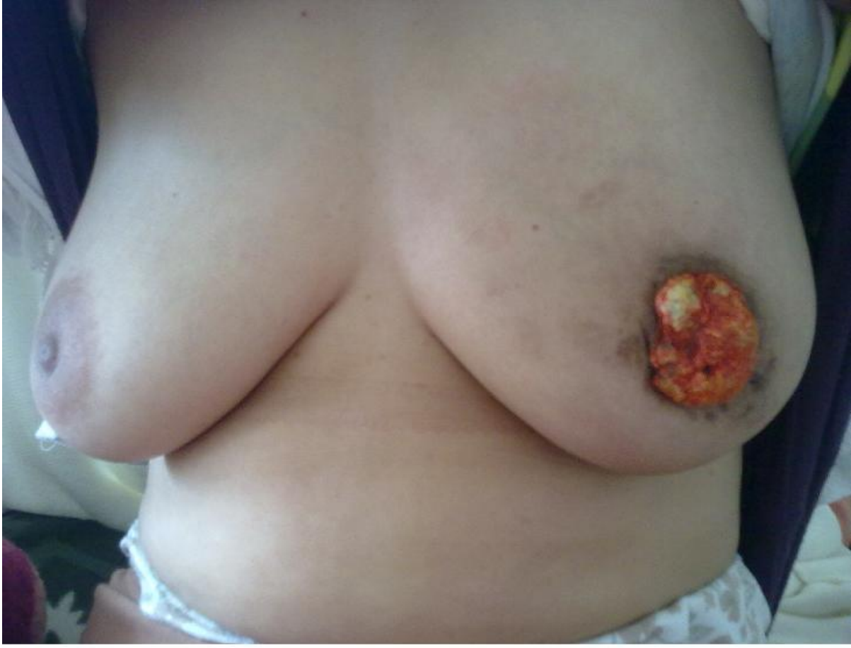
Figure 5 Aspect du sein à 5 mois d'évolution sous traitement