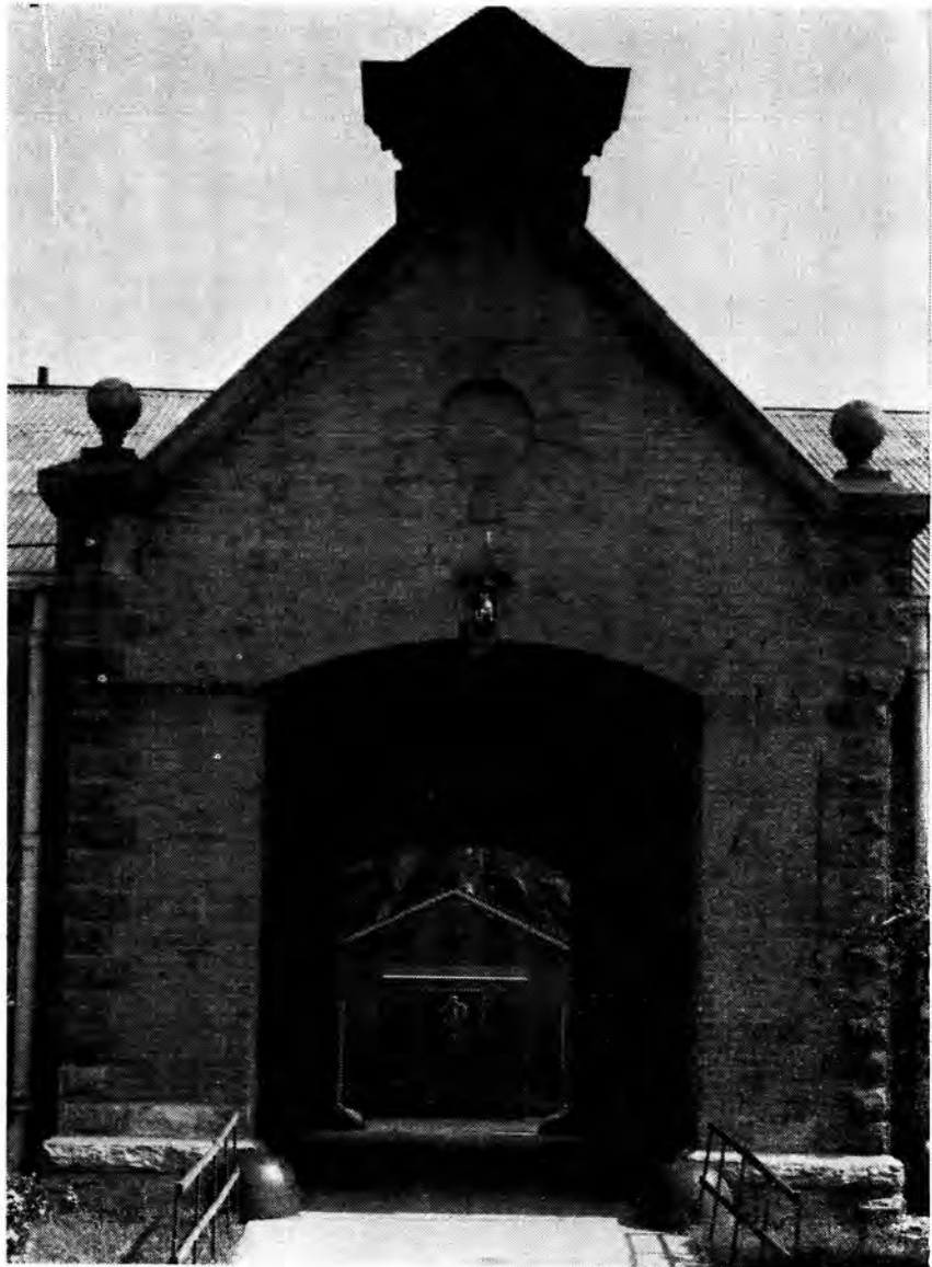
Die poort van een van die voormalige kanon- en waenhuise van die Korps Staatsartillerie, Potgieterstraat, Pretoria. Op die agtergrond 'n geboutjie wat later op die binneplaas gebou is.