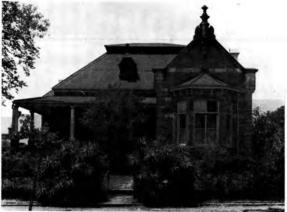
Een van die voormalige offiserswonings, Korps Staatsartillerie, Pretoria.