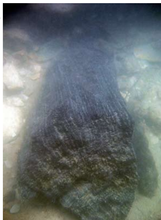
1. datation dendrochronologique par le laboratoire CEDRE de Besançon

donc bien attestée sous la forme de dépôts d'inondations recouvrant les niveaux d'occupation dès le milieu du 1 er siècle de notre ère. Ces différentes occurrences de crues du Doubs au début de l'époque gallo-romaine sont synchrones de celles enregistrées dans les bassins voisins du Rhin, de la Saône et du Rhône.