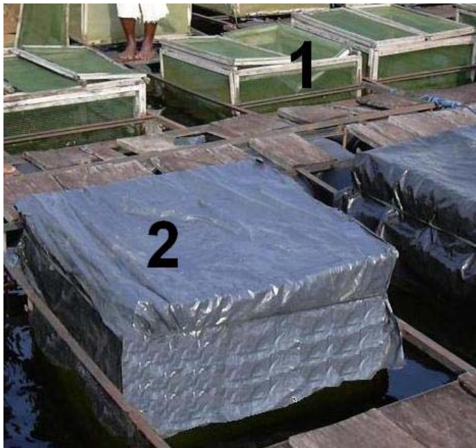
Figure 1 : Vue partielle des cages flottantes utilisées dans le lac de barrage d'Ayamé pour l'élevage du poisson-chat africain H. longifilis (1 : cage non couverte et 2 : cage couverte)

Les alevins de poids moyen 0,8 \pm 0,1 g utilisés au cours de ce travail ont été obtenus en éclosérie par fécondation artificielle selon Slembrouck & Legendre (1988) à partir de géniteurs capturés dans la rivière Bia (Côte d'Ivoire). La densité de mise en charge dans les cages est de 100 \text{ individus.m}^{-3} . L'expérience a duré 90 jours (avril à juillet 2003).