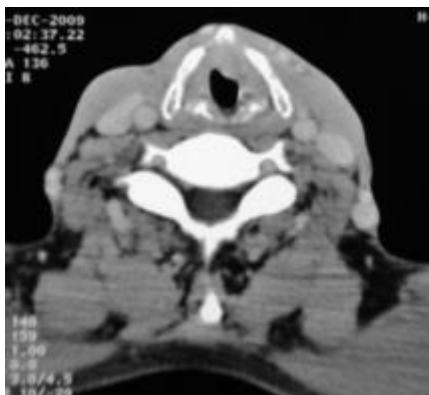
Fig. 1 : Scanner cervical : Processus tumoral de la corde vocale gauche.