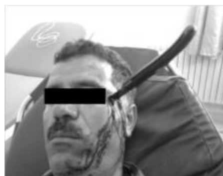
Fig 1 : Vue de face : Couteau implanté dans la région temporale gauche.

Un homme âgé de 37 ans est victime d'une agression par un coup de couteau qui est resté fiché dans la région temporale gauche (figure 1,2). Le patient était par ailleurs conscient bien orienté dans le temps et dans l'espace, stable sur le plan hémodynamique et respiratoire avec une tension artérielle à 130/70mmhg, sans déficit sensitivo-moteur ni atteinte des paires crâniennes. L'acuité visuelle était conservée. L'auscultation du globe oculaire n'objectivait pas de souffle vasculaire en faveur d'une fistule carotido-caverneuse. Le reste de l'examen était sans particularités. Deux voies d'abord veineuses périphériques, ont été posées, de l'oxygène a été administré au masque à haute concentration. Une antibiothérapie intraveineuse (1 g d'amoxicilline-acide clavulanique) et une antalgie (paracétamol intraveineux 1 g) ont été instaurées.