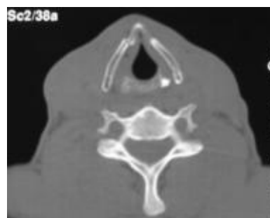
Fig 1 : TDM cervical en coupe axiale : fracture non déplacée du cartilage thyroïde

La tomodensitométrie cervicale, réalisée chez 16 patients (54%), a montré un œdème laryngé isolé dans 6 cas (37%), une fracture du cartilage thyroïde dans 3 cas (27%) (Fig. 1 et 2), du cartilage cricoïde dans 2 cas (Fig. 3), de l'os hyoïde dans 2 cas, et de la trachée dans 1 cas. Une luxation cricoaryténoïdienne a été notée dans 2 cas. Au décours de ces examens, tous nos patients ont été classés selon la classification de Schaefer modifiée par Fuhrman (Tableau I). Plus que la moitié des malades (54%) étaient classés en stade I et II. Les stades III et IV ont été respectivement trouvés dans 17 et 26% des cas.