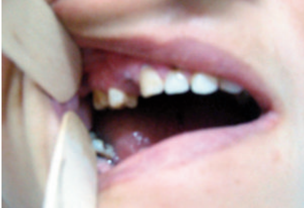
Fig. 2 : Mauvaise implantation dentaire, lésions papuleuses au niveau des gencives.

L'examen de la cavité buccale trouve une mauvaise implantation dentaire avec des lésions papillomateuses de couleur rose pâle au niveau des gencives (figure 2).