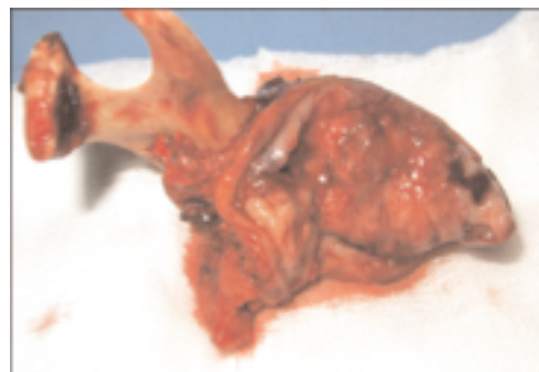
Fig 1 : Pièce de BPTM avec désarticulation temporomandibulaire

Les patients ont été subdivisés en 2 groupes: un premier groupe comportant ceux qui ont eu mandibulectomie segmentaire interruptrice (MS) avec ou sans réparation par attelle, et un deuxième comportant ceux qui ont eu une mandibulectomie conservatrice (MC) laissant une baguette osseuse basale. Dans chaque groupe les résultats fonctionnels, les taux de rémission et de survie ont été évalués.