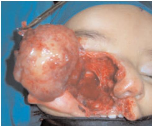
Fig. 4 : Vue per-opératoire : Exérèse complète de la tumeur en monobloc.