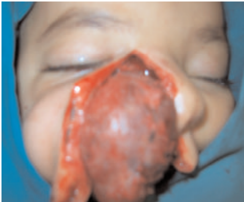
Fig. 3 : Vue per-opératoire montrant l'abord para-latéro-nasal droit de la tumeur.

L'examen anatomo-pathologique de la pièce opératoire a retenu le diagnostic de myxome du maxillaire. Les suites opératoires étaient simples. L'enfant est suivi régulièrement depuis deux ans. La tumeur n'a pas récidivé.