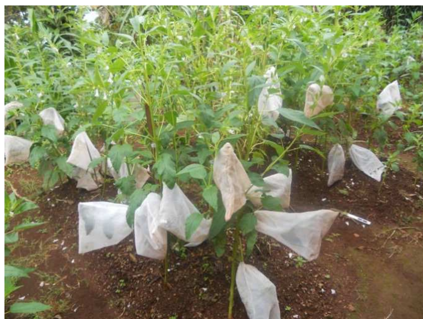
Figure 2 : Pied de sésame montrant des fleurs protégés des insectes.