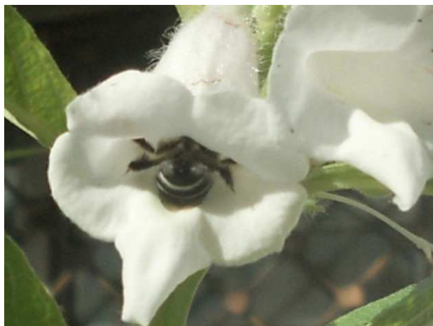
Figure 3: Amegilla sp. butinant du pollen dans une fleur de sésame.