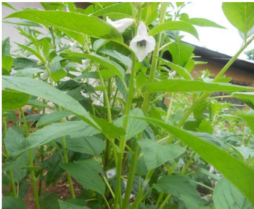
Figure 1 : Pied de sésame montrant des fleurs laissées en libre pollinisation.