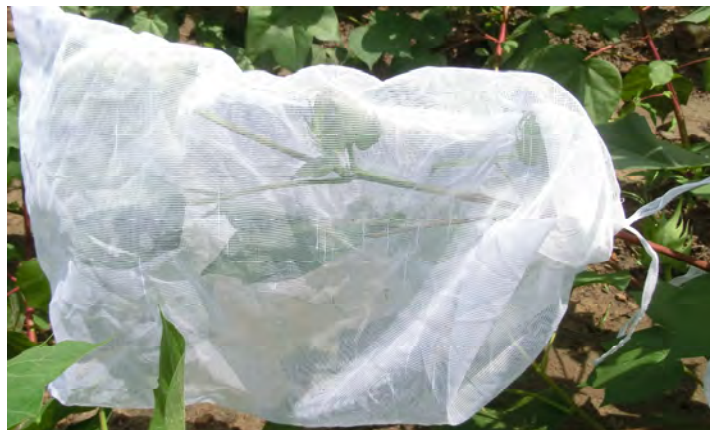
Photo 1 : Branche fructifère portant les boutons floraux dans le manchon.