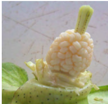
Photo 10 : Bouton floral sain disséqué montrant les étamines normales.