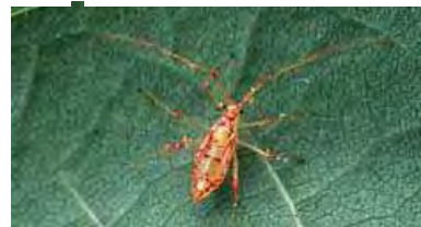
Photo 6 : Helopeltis schoutedeni (Reuter, 1906) (larve) (Poutouli et al., 2012).