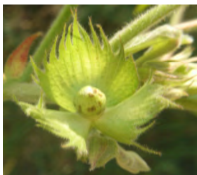
Photo 7 : Nécroses brunes des piqûres nutritionnelles des mirides sur les pétales du bouton florale.

*Boutons floraux tombés sans symptômes de piqûres.