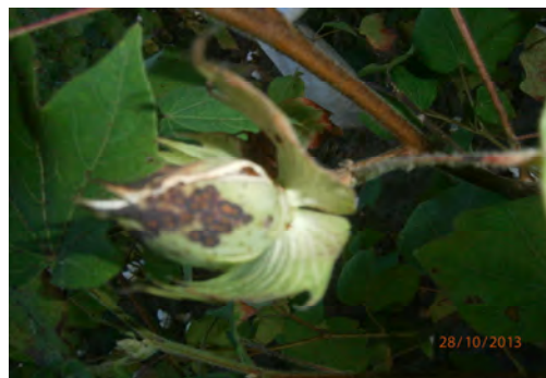
Photo 12 : Chancre causés par H. schoutedeni sur capsule et ouverture prématurée de celle-ci.