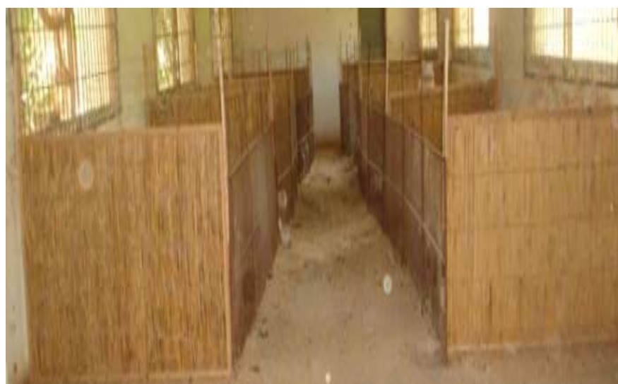
Figure 1: Disposition des boxes.

Des exposants différents sur la même ligne indiquent des différences significatives ( p < 0,05 ) en fonction des régimes alimentaires.