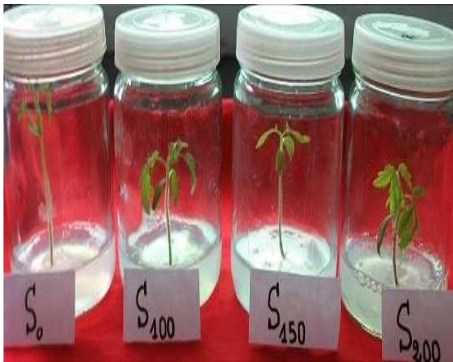
Photo1: Différence de croissance observée entre S0 ; S100 ; S150 et S200. Semences de tomate irradiées avec 0 ; 100 ; 150 et 200 gray.

Pendant la régénération in vitro des plantes de tomate, nous avons observé que le NaCl ralentit la croissance des pousses de tomate. En effet, les plantes régénérées tolérantes au NaCl ont une croissance et une surface foliaire réduites comparativement aux plantes témoins. Toutefois, la comparaison entre les plantes régénérées nous amène à dire que le rayonnement gamma semble stimuler la croissance des pousses en présence de NaCl.