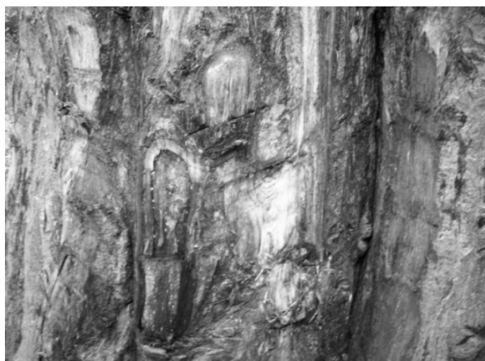
Photo 1: Ecorçage de l'arbre Adansonia digitata L. dans le Bois sacré Covèzoun.

Du Tableau 4, il ressort que l'indice de pression pastorale est faible dans tous les bois sacrés. Ils sont sous pression pastorale : IP \leq 3 dans 14 bois sacrés ; IP moyenne dans 9 bois sacrés ( 3 < IP \leq 6 = 9 ) ; IP forte dans 6 bois sacrés ( IP > 6 = 6 ). Au Bénin, les placettes installées dans 61 bois sacrés ont montré que 29 sont sous la pression des bovins. Le Tableau 5 permet d'apprécier le statut de certaines espèces par rapport à la liste rouge de l'UICN.