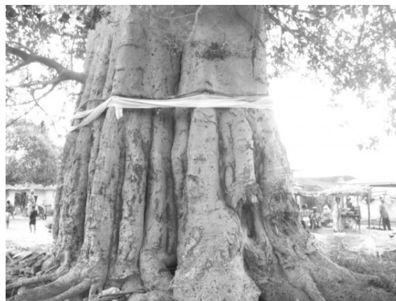
Photo 2: Adansonia digita L. sacré en plein cœur du village de Toui au Centre Bénin.