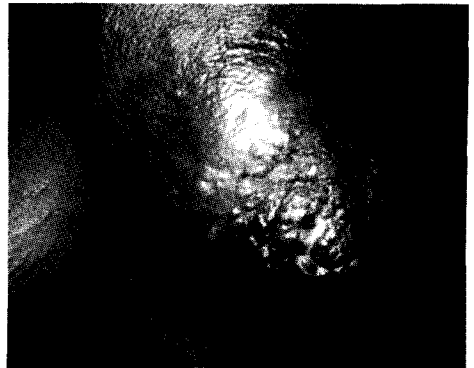
Figure 1- Mastite carcinomateuse en voie d'ulcération.

Enfin, l'expérience du centre d'Oncologie de Douala souligne bien l'intérêt de la multiplication des postes de consultations avancées en Oncologie, afin de minimiser l'impact de l'inégalité dans la répartition géographique des services spécialisés. Encore faut-il pour cela que de jeunes oncologues soient formés et viennent renforcer la vieille garde ■