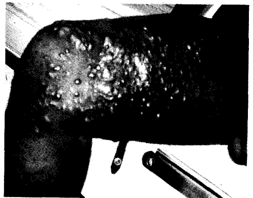
Figure 2- Nodules de Kaposi coalescents faisant placard infiltratif.