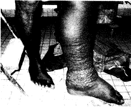
Figure 3- Important lymphoedème du membre inférieur gauche dans un sarcome de Kaposi épidémique.