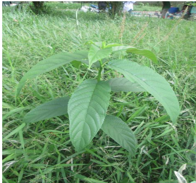
Figure 2 : Une vue du jeune plant de Milicia regia (Moraceae), dans le jardin public 1

Les genres les plus représentés sont : Ficus et Cassia (4 espèces chacun), Commelina avec 3 espèces essentiellement présentes dans le Jardin du tribunal. Les espaces les plus riches floristiquement sont les jardins publics 1 et 2 avec respectivement 50 et 40 espèces ( Tableau 1 ). Les différents boulevards, avec 6 à 7 espèces sont les plus pauvres. Ces variations sont également observées pour les niveaux taxonomiques genres et familles ( Tableau 1 ). Du point de vue de la chorologie, au total, 47 espèces exotiques ont été recensées dans les différents espaces. Le nombre d'espèces exotiques est plus élevé dans les deux jardins publics 1 et 2 avec respectivement 25 et 39 espèces. C'est également dans ces jardins en plus de celui du tribunal, que le nombre d'espèces de la région phytogéographique Guinéo-Congolaise (GC) est plus grand. Ces espèces GC sont au nombre de 44 dans l'ensemble des espaces investigués. Parmi elles, figurent Milicia regia (Moraceae), l'Iroko, une espèce endémique et menacée d'extinction, dont l'unique individu a été recensé dans le jardin public 1 ( Figure 2 ).