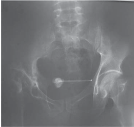
Fig. 1: ASP: Broche d'ostéosynthèse se projetant au niveau de l'aire vésicale, on note également calcul à son bout interne.