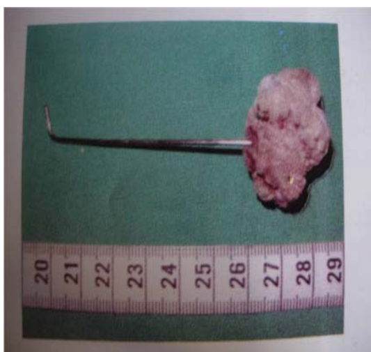
Fig. 3: Aspect du matériel après le geste chirurgical, mesurant environ 10cm.

chirurgie pariétale 5 , et d'éléments de cerclage d'une disjonction pubienne 6 . Les mécanismes qui favorisent la migration sont encore mal connus. Les dispositifs intra-utérins, classiquement rapportés 7,8,10 , induisent une inflammation empêchant la nidation mais pourrait favoriser la destruction endométriale et la migration. Heetvel rapporte le cas d'une femme opérée d'une disjonction de la symphyse pubienne qui consulte neuf ans plus tard pour l'élimination spontanée d'une vis; L'auteur pense que l'instabilité symphysaire a aidé au déplacement du matériel auquel se surajoute l'inflammation, la fistulisation et l'infection d'origine urinaire. Cette explication s'appliquerait aussi à notre patient du fait de la constatation d'une instabilité persistante de la hanche ainsi que les remaniements probablement inflammatoires de la colonne postérieure de la hanche.