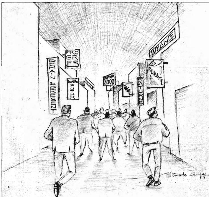
Les noms des cercles de qualité rappellent qu'ils veulent préparer l'avenir.

Mais attention aux effets pervers. Quels peuvent être les enjeux des ouvriers ainsi mis en compétition? Le contremaître de la chaîne estime que «les gars, ils ont deux choses sur lesquelles ils ne veulent pas être attaqués. Ils ne veulent pas être attaqués sur la qualité de leur travail et ils ne veulent pas être le dernier du module». Or, il y a deux moyens d'être bien placé: soit faire peu de défauts, soit que les autres en fassent plus. C'est pourquoi un monteur, s'il s'aperçoit de l'oubli d'une pièce au poste