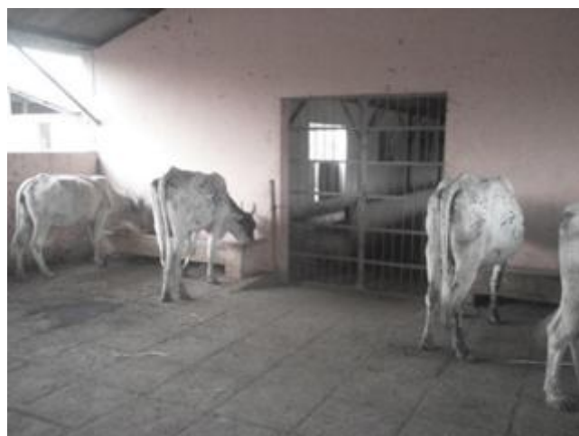
Figure 1 : Les vaches métisses (Gir x Borgou) à la FEO.

Les vaches du lot 2 et du lot 3 recevaient respectivement 1 et 2 kg de drêche de sorgho séchée. Elles étaient attachées dans un bâtiment de 98 m 2 , et espacées de 2 m les unes des autres pour s'assurer que chaque animal ne consomme que la quantité qui lui était servie (Figure 1). Les vaches du lot 1 (lot témoin) étaient laissées dans un parc à stabulation libre. Pendant l'essai, l'abreuvement se faisait au pâturage dans le fleuve Okpara et le soir à l'étable, ad libitum . Les animaux avaient aussi libre accès à la pierre à lécher.