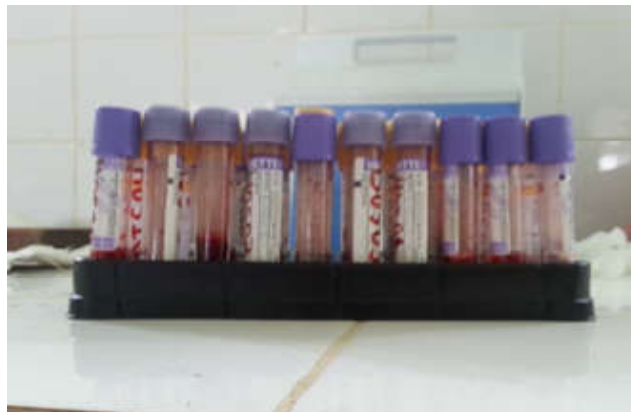
Figure 5 : Tubes violets.

prélèvements, les échantillons sont transportés au laboratoire de l'institut Pasteur d'Abidjan pour les analyses hématologiques à l'aide d'un hémogramme de type Sysmex-XN 1000 (figure 6).