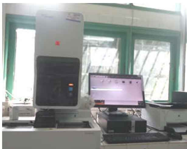
Figure 6 : Hémogramme de type Sysmex-XN 1000.