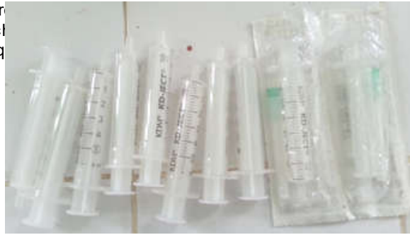
Figure 4 : seringues.

Snieszko S. F. 1960. Microbiology in fishery research. Speces. Scientifiq