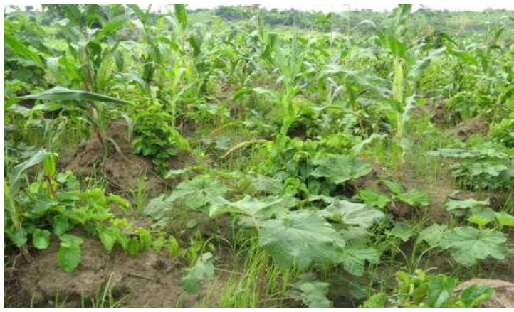
Figure 6 : Une association maïs-gombo-igname-riz.