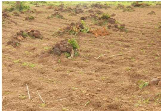
Figure 2 : Tas de pierres. Pile of stones.

créer des retenues d'eau dans les champs et de gérer la fertilité des sols. Le paillage du sol est une méthode également utilisé par les