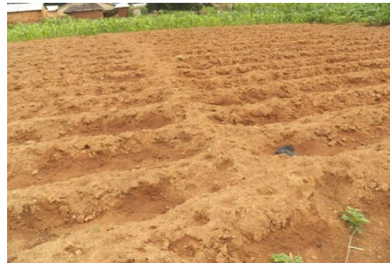
Figure 3 : Diguette en billon. Diguette in ridges.

producteurs pour la conservation de l'humidité du sol (21 %). Toutes ces formes de conservation des eaux et des sols rencontrés