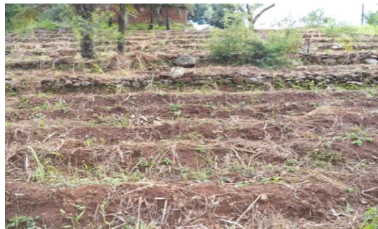
Figure 4 : Paillage du sol. Soil mulching.