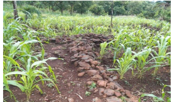
Figure 5 : Cordon de pierres. Stone cord.

sont présentées sur les figures 2, 3, 4 et 5.