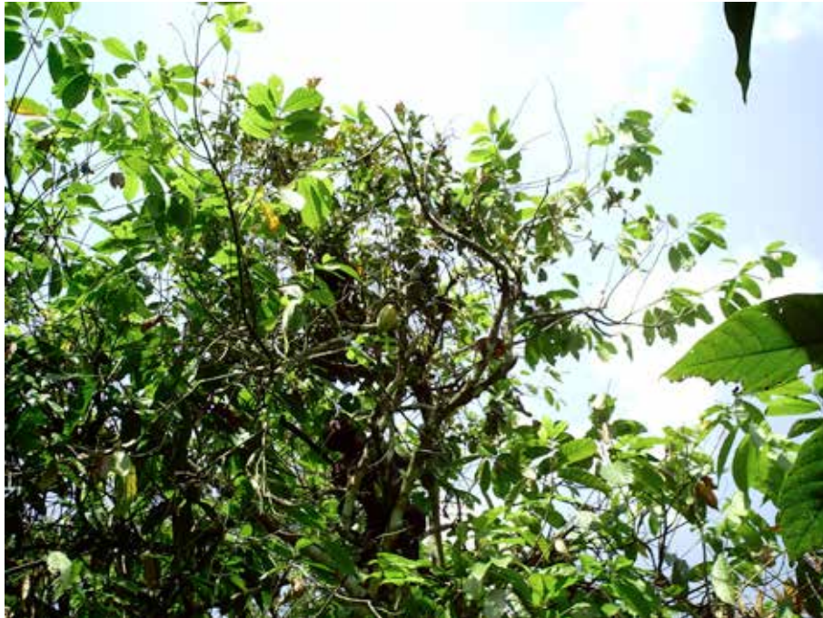
Figure 5 : Un cacaoyer, Theobroma cacao L. (Sterculiaceae), densément infesté par les Loranthaceae.

Cocoa tree, Theobroma cacao L. (Sterculiaceae), densely infested by mistletoes