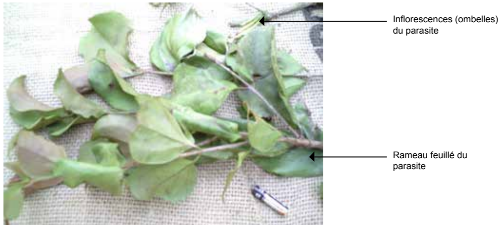
Figure 2 : Rameaux feuillés et florifères de Phragmanthera capitata var. Alba (Spreng.) Ballé (Loranthaceae). Foliage and floriferous branches of Phragmanthera capitata var. Alba (Spreng.) Ballé (Loranthaceae).