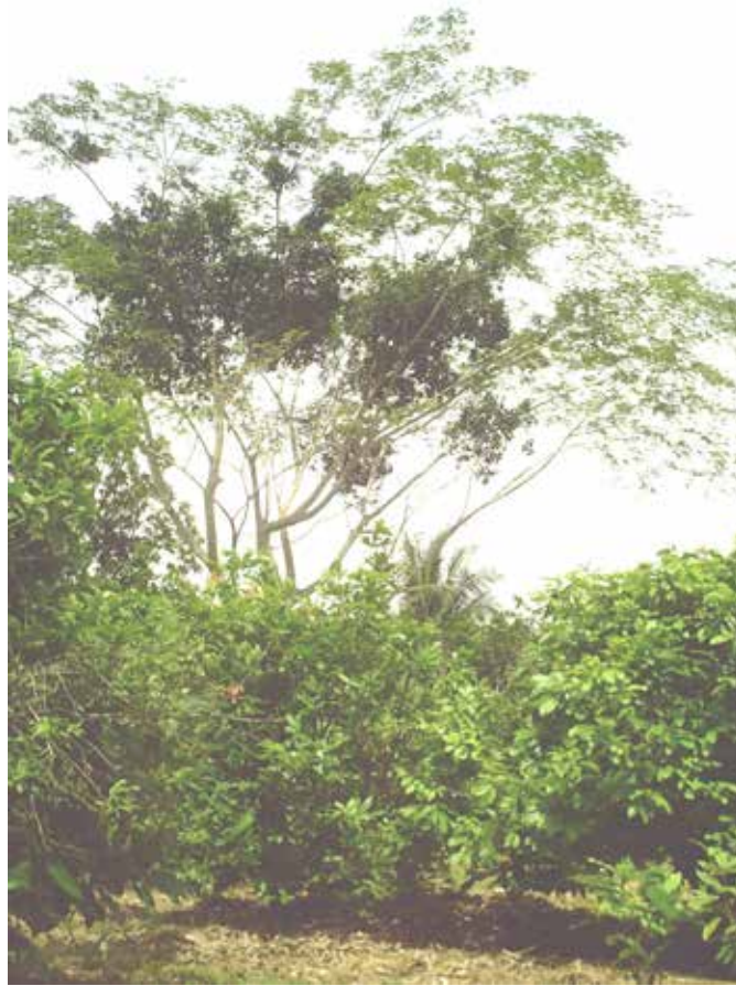
Figure 6 : Un Albizia adianthifolia (Schumach.) W.F. Wright (Mimosaceae) densément infesté par les Loranthaceae.

Albizia adianthifolia (Schumach.) W.F. Wright (Mimosaceae), densely infested by mistletoes