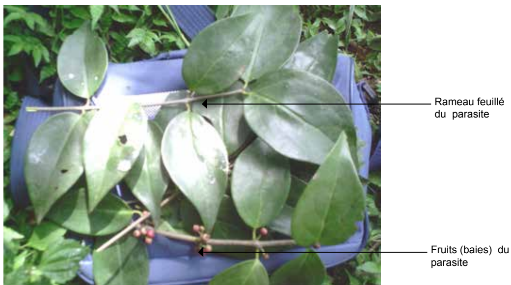
Figure 1 : Rameaux feuillés et fructifères de Globimetula dinklagei subsp. assiana (Engl.) Danser (Loranthaceae).

Foliage and fructiferous branches of Globimetula dinklagei subsp. assiana (Engl.) Danser (Loranthaceae)