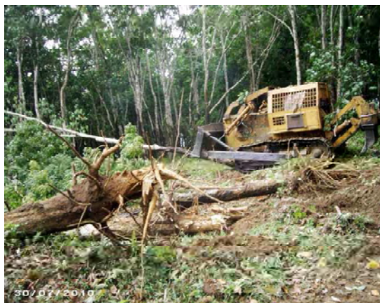
a : Abattage des arbres au Bulldozer