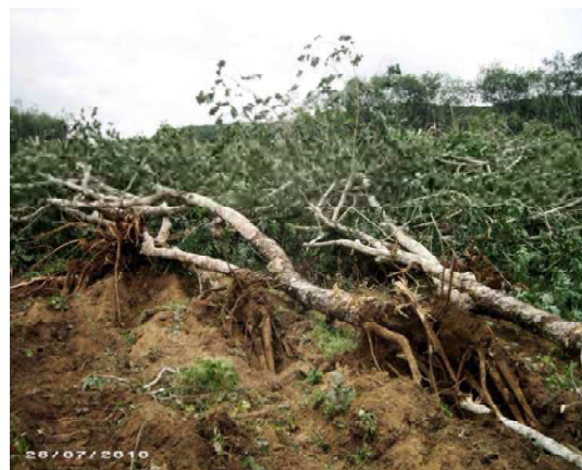
b : Vue d'une parcelle abattue