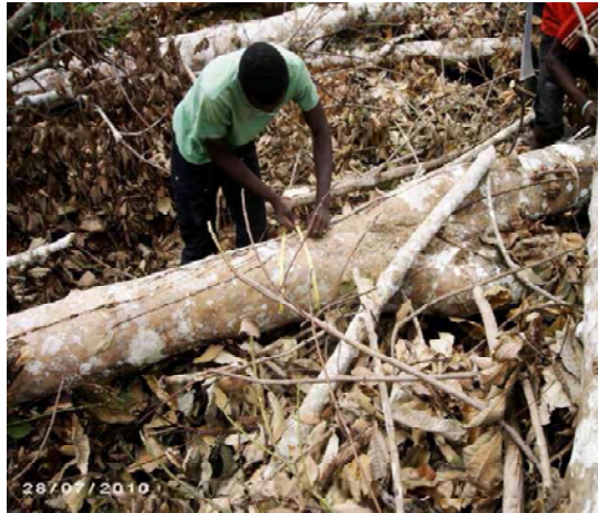
a : Mensuration du fût