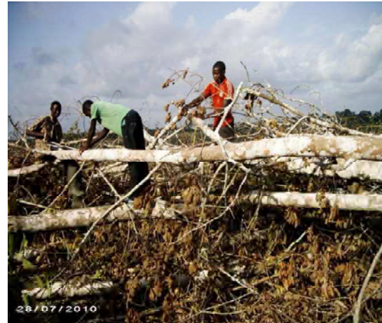
b : Mensuration des branches