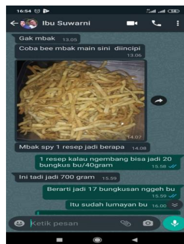
Gambar 3: Anggota SEKOPER yang Telah Berhasil memproduksi Olahan Stik Lidah Buaya

Pembuatan stik lidah buaya dilakukan dengan metode daring, yakni menggunakan video yang diunggah di Youtube dan linknya dibagikan di Grup Whatsapp . Anggota yang telah berhasil seperti yang ditunjukkan pada gambar 3.