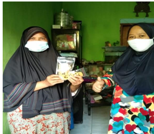
Gambar 6. Penyerahan Stik Dayya Ummat kepada Koordinator Creativepreneur Healthy Food Anggota SEKOPER