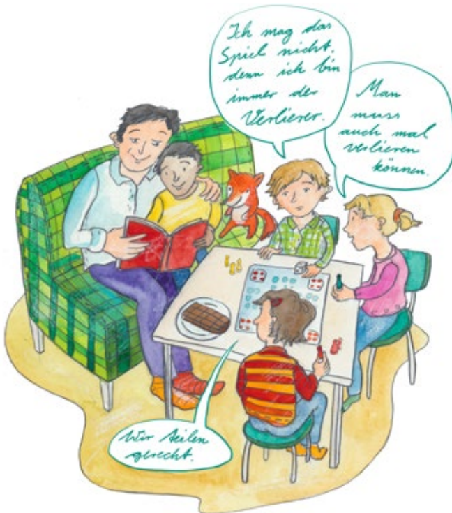
Emotionale und soziale Entwicklung

ne Wünsche äußert. Gemeinsam mit anderen Menschen in ihrem Umfeld werden sie altersgerecht in Entscheidungen einbezogen und finden Lösungen für Probleme. Daraus erwächst Selbstvertrauen. Im alltäglichen Miteinander lernen die Kinder so auch mal Misserfolge zu verkraften, andere zu verstehen und Aufgaben gemeinsam zu meistern.