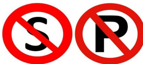
Gambar 2: Rambu Dilarang Berhenti dan Parkir

Kemudian, arti dari rambu dilarang Berhenti adalah setiap pengendara Kendaraan Bermotor tidak boleh menghentikan kendaraannya di lokasi yang terpasang rambu, dan larangan ini berlaku tanpa pengecualian meskipun hanya Berhenti dalam hitungan detik atau dalam situasi darurat. Sementara itu untuk rambu dilarang Berhenti berbentuk lingkaran dengan warna dasar putih dan dibagian tepinya menggunakan warna merah, dan juga rambu ini menggunakan huruf S dicoret. Huruf S ini, menggunakan warna merah. Rambu berwarna merah ini menandakan suatu larangan tertentu, misalnya dilarang huruf S dicoret. Rambu ini menandakan bahwa tidak boleh Berhenti dengan alasan apapun. Adapun, arti dari rambu dilarang Parkir adalah setiap pengendara tidak boleh memarkir kendaraan tersebut dalam keadaan mesin mati dan meninggalkan kendaraan di lokasi tempat terpasangnya rambu.