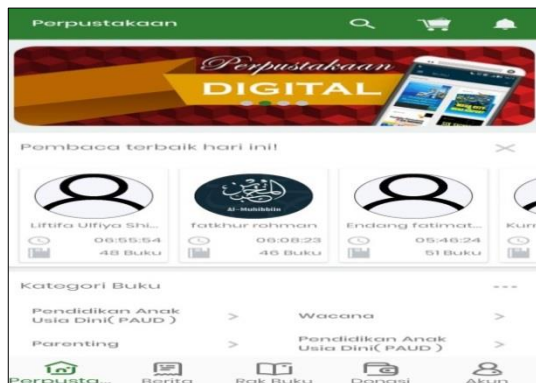
Gambar 2. Tampilan aplikasi perpustakaan digital LITERASIA IAIN Kudus

Jika membutuhkan koleksi buku dapat mengakses aplikasi perpustakaan digital LITERASIA IAIN Kudus yang aplikasinya dapat diunduh secara free di google playstore . Kemudian, jika pemustaka membutuhkan referensi tugas akhir (skripsi atau tesis) dapat diakses secara utuh melalui portal repositori eprints IAIN Kudus melalui laman repository.iainkudus.ac.id .