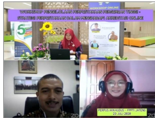
Gambar 3. Workshop Online Perpustakaan IAIN Kudus

bertema “ Pengelolaan Perpustakaan Perguruan Tinggi, Strategi Perpustakaan Dalam Menghadapi Akreditasi Online ” serta kegiatan user education mahasiswa baru IAIN Kudus berbasis daring.