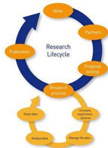
Gambar 3. Research lifecycle framework (Joint Information Systems Committee, 2013)

Instrumen penelitian yang digunakan merupakan pengembangan dari research lifecycle framework yang dikemukakan oleh Joint Information Systems Committee (JISC) , seperti terlihat pada Gambar 1. Tahapan riset dalam research lifecycle framework yang dikembangkan oleh JISC meliputi: pengembangan gagasan, identifikasi stakeholder riset, penulisan proposal, pelaksanaan riset dan publikasi.