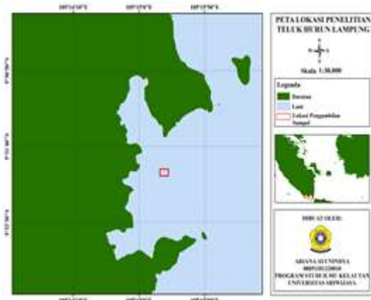
Gambar 1. Lokasi sampling