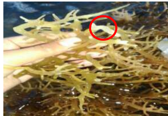
Gambar 3. K. alvarezii yang terkena ice-ice

Gambar 2A merupakan morfologi K. alvarezii hasil penelitian ini, sedangkan 2B merupakan hasil penelitian Parenrengi dan Sulaeman pada Tahun 2007. Rumput laut K. alvarezii yang ditemukan memiliki ciri-ciri pemutihan pada bagian ujung thallus yang awalnya sedikit dan semakin lama melebar ke bagian percabangan. Warna thallus K. alvarezii terlihat seperti transparan dan struktur yang lebih lunak dan mudah hancur daripada thallus yang tidak mengalami perubahan warna. Ciri-ciri ini menunjukkan rumput laut K. alvarezii yang dibudidayakan di Balai Besar Perikanan Budidaya Laut Lampung ini telah terserang penyakit ice-ice (Gambar 3).