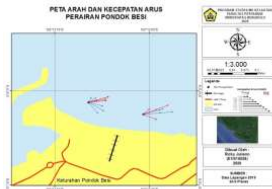
Gambar 2. Peta arah dan kecepatan arus

rata - rata kecepatan arus pada Titik A adalah 0,21 m/detik sedangkan pada Titik B adalah 0,20 m/detik. Rata-rata kecepatan arus di Titik B lebih tinggi daripada kecepatan arus di Titik A. Hal ini dikarenakan terdapat bangunan pantai pada titik tersebut. Bangunan pantai dapat melemahkan energi gelombang yang menyebabkan terjadinya pergerakan air juga terhambat dapat terhambat. Peta data aru dapat dilihat pada Gambar 2.