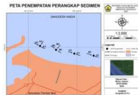
Gambar 1. Peta penempatan perangkat sedimen

Pengambilan sampel sedimen dengan menggunakan perangkat sedimen yang dipasang selama 5 hari (Sibarani, 2019). Perangkat sedimen dipasang pada 4 titik di lokasi pengamatan. Pada titik 1 dan 2 terdapat tiga perangkat sedimen yang dipasang di sebelah kiri dermaga. Hal ini dikarenakan untuk mengetahui laju sedimentasi yang dipengaruhi oleh adanya bangunan pantai yang menyebabkan terjadinya difraksi gelombang sehingga kemungkinan terjadi arus tegak lurus terhadap pantai dan arus sejajar garis pantai. Sedangkan pada Titik 3 dan 4 diletakkan di sebelah kanan dermaga. Pada titik ini terdapat dua perangkat sedimen yang menghadap ke arah sejajar garis pantai. Penentuan lokasi pengamatan dilakukan secara purposive sampling . Metode purposive sampling yaitu metode titik sampling yang dianggap telah mewakili kondisi perairan pada lokasi penelitian. Penentuan titik sampel dengan memperhatikan sistem transpor sedimen sejajar pantai, dimana lokasi tersebut terindikasi terjadinya sedimentasi. Peta Penempatan perangkat sedimen dapat dilihat pada Gambar 1.