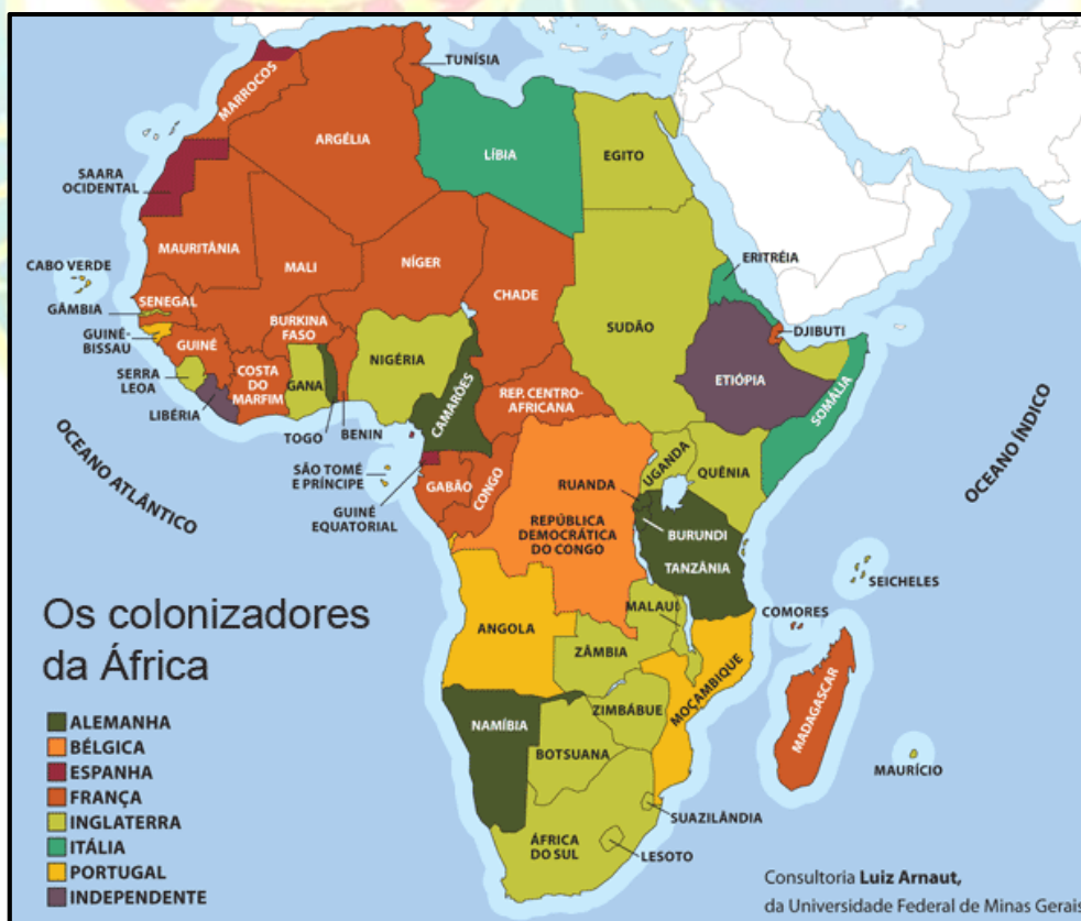
Mapa 01: Divisão política da África e seus colonizadores.