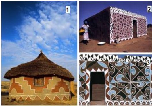
Figuras 1, 2 e 3 – Habitação Basotho e arte Litema

natureza na construção do cotidiano. Por exemplo, na sociedade Basotho, também conhecida como suthu ou suto, estabelecida nos altos campos da África Austral, principalmente na África do Sul e Lesoto, as habitações são construídas pelos homens e os murais de padrões geométricos são pintados pelas mulheres, dando vida à arte Litema (figuras 1-3). Os padrões geométricos da arte Litema são feitos em formas de mandalas e são orações pintadas, endereçadas aos antepassados e apelando para a estação chuvosa. Quando a chuva vem, lava os desenhos dos murais, que são substituídos ou rejuvenescidos no ano seguinte.