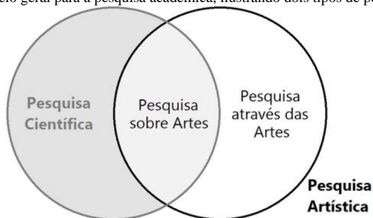
Figura 1. Modelo geral para a pesquisa acadêmica, ilustrando dois tipos de pesquisa artística

Em relação aos métodos de investigação adotados na pesquisa artística, é interessante a classificação feita pelo historiador inglês Christopher Frayling e aprimorada por Borgdorff (2012). Ela deixa evidente as particularidades que a pesquisa artística possui em relação aos métodos científicos convencionais. Adiante, iremos apresentar uma proposta simplificada do modelo (Figura 1):