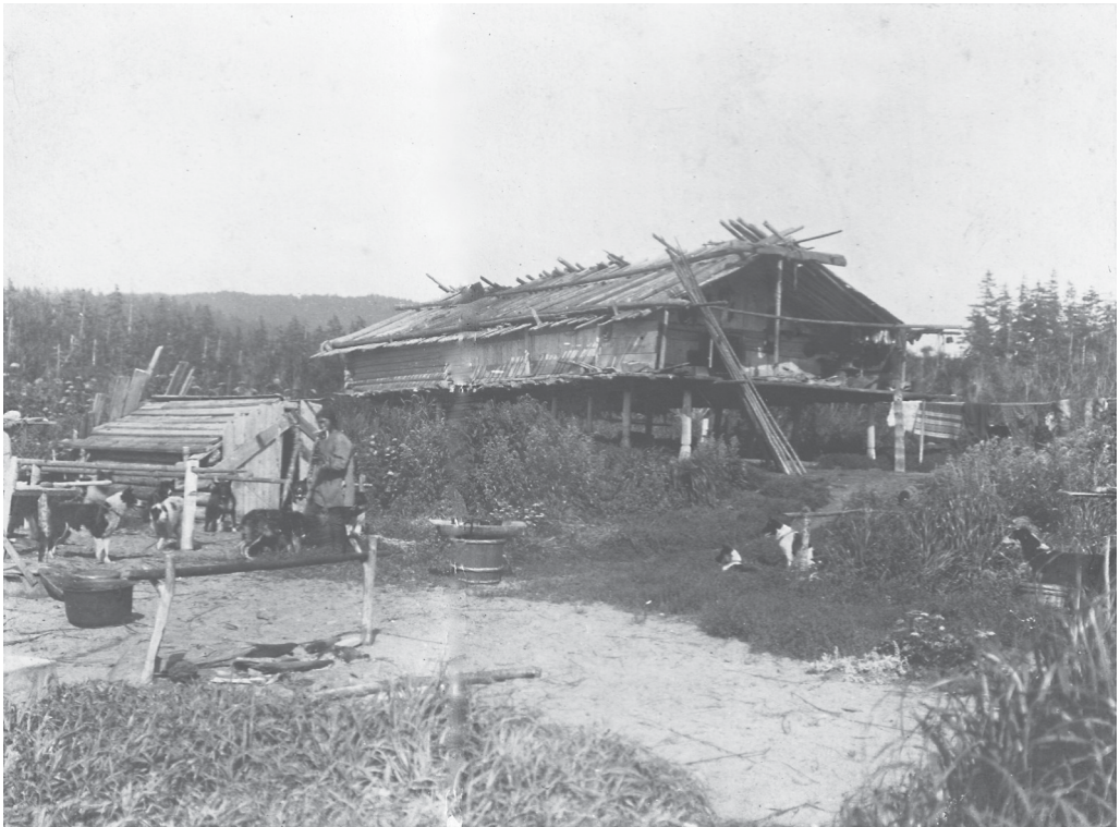
Рис. 2. Летнее свайное жилище нивхов на р. Мынгине. Fig. 2. Nivkh summer pile dwelling on the River Myngin.

Забота администрации об инородцах ничтожна. Они страдают от отсутствия медицинской помощи и представлены всецело для эксплуатации скупщикам, спаивающим их до иступления. Священники появляются изредка и тогда совершают массовые свадьбы и крещения. Образование не проникает к инородцам совершенно [Полевой, 1914, с. 599].