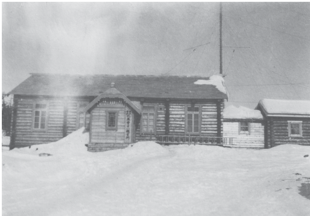
Рис. 3. Радио в Охе. Фото П. И. Полевого

На фотографии П. И. Полевого «Радио в Охе» [СОКМ, КП 6422/7] (рис. 3) изображен бревенчатый дом с радиомачтой на крыше. Крыша дома двускатная, покрыта фанерой; конек крыши выступает с двух сторон (на концах), как это характерно для японской архитектуры конца XIX — начала XX в. С западной стороны дома сделана привходовая пристройка с надписью на японском языке. Перед входом к стене дома прислонена деревянная лестница. Видны четыре больших окна, плотно зашторенных. Маленькое окно в пристройке выполнено в японском стиле. С торца конторы пристроен несколько меньший по размерам сруб, помещения соединены между собой проходом. На заднем плане высится радиомачта. С левой стороны от конторы видна лесополоса.