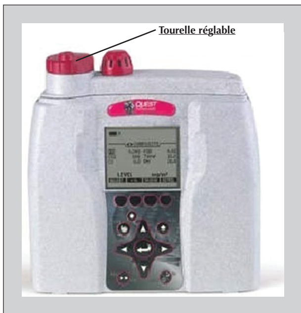
Figure 3. QUEST ou EVM-7.