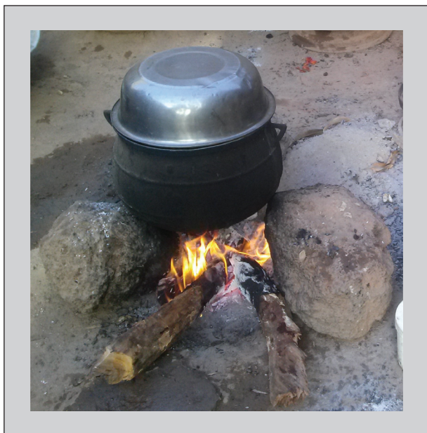
Figure 1. Cuisson du repas à l'aide de foyer traditionnel.

Figure 1. Cooking a meal over a traditional fire.