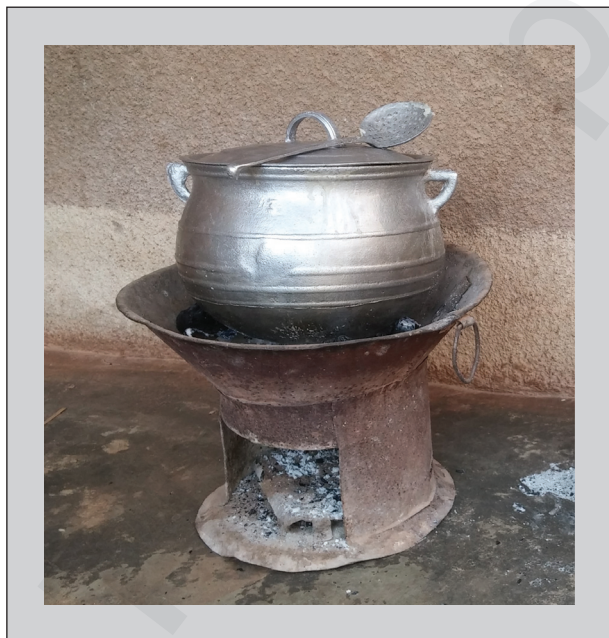
Figure 4. Cuisson du repas à l'aide de foyer amélioré.

Les résultats montrent que 37,5 % des ménages utilisaient la biomasse (bois ou charbon de bois) comme