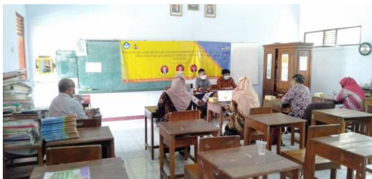
Gambar. 1 Pelaksanaan pengabdian pada materi perencanaan pembelajaran

Pada sesi materi pelaksanaan pembelajaran diisi dengan keterampilan guru dalam melaksanakan rencana pembelajaran, pengelolaan kelas, dan penggunaan teknologi dalam pembelajaran. Pelaksanaan pembelajaran adalah proses yang diatur sedemikian rupa menurut langkah-langkah tertentu agar mencapai hasil yang diharapkan (Sudjana, 2017: 136). Pelatihan dan pendampingan berupa penggunaan teknologi dalam pembelajaran, berupa google classroom , power point , dan quizizz . Membahas pelaksanaan strategi pembelajaran dari langkah-langkah pembelajaran. Strategi pembelajaran yang disajikan adalah Information Search (Mencari Informasi), Poster Comment (Komentar Gambar), Poster Session (Pembahasan Gambar), dan Modelling the Way (Membuat Contoh Praktik). Terdapat contoh pelaksanaan praktis pembelajaran yang tepat dalam pembelajaran COVID-19 . Bukti pelaksanaan pengabdian di bawah ini.