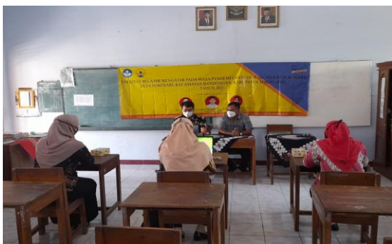
Gambar 2. Pengabdian materi pelaksanaan pembelajaran

Pada sesi materi pelaksanaan pembelajaran diisi dengan keterampilan guru dalam melaksanakan rencana pembelajaran, pengelolaan kelas, dan penggunaan teknologi dalam pembelajaran. Pelaksanaan pembelajaran adalah proses yang diatur sedemikian rupa menurut langkah-langkah tertentu agar mencapai hasil yang diharapkan (Sudjana, 2017: 136). Pelatihan dan pendampingan berupa penggunaan teknologi dalam pembelajaran, berupa google classroom , power point , dan quizizz . Membahas pelaksanaan strategi pembelajaran dari langkah-langkah pembelajaran. Strategi pembelajaran yang disajikan adalah Information Search (Mencari Informasi), Poster Comment (Komentar Gambar), Poster Session (Pembahasan Gambar), dan Modelling the Way (Membuat Contoh Praktik). Terdapat contoh pelaksanaan praktis pembelajaran yang tepat dalam pembelajaran COVID-19 . Bukti pelaksanaan pengabdian di bawah ini.