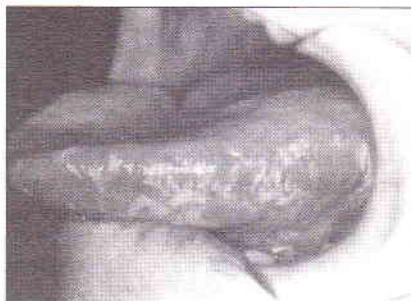
Fig. 2 Manchas esbranquiçadas na borda lateral esquerda da língua, com aspecto clínico sugestivo de leucoplasia pilosa