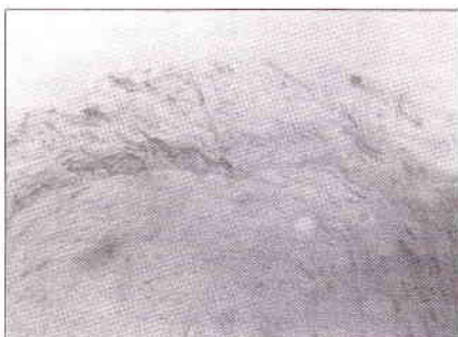
Fig. 4 Coloração pelo P.A.S., demonstrando as hifas de Candida albicans nas camadas mais superficiais do tecido epitelial