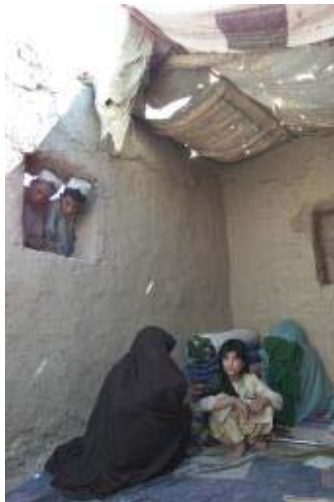
Familia afgana refugiada.

“Afganistán el país con mayor número de refugiados, y donde más de 5 millones de personas podrían morir en este momento de hambre”.