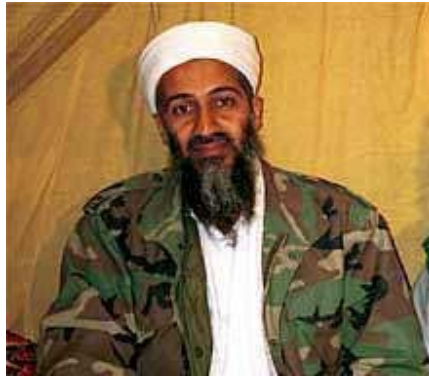
Osama Bin Laden