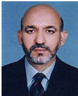
Hamid Karzai – Actual Presidente Interino “Un reto para el futuro de Afganistán”

Fuente: Agencia Internacional de Energía