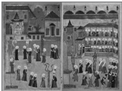
Bild 16: Aus der „Parade der Zünfte“: Die Zunft der kemha -Weber präsentiert ihre kostbaren und aufwendig gewebten Seidenstoffe (1583)

Selim I. (1512–1520) hatte das persische Täbris und Herat erobert und brachte dort tätige Künstler nach Istanbul, die den persischen Kunststil verbreiten sollten. Die osmanischen Maler entwickelten daraus