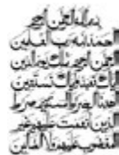
Bild 17: Kalligrafie der Ersten Sure des Korans von Shalid Alam aus der Neuübertragung des Korans von Hartmut Bobzin (2010)

hebräischen Texten und in der arabischen und osmanischen Kalligrafie bis in die jüngste Zeit fortgesetzt. Die Kalligrafie als eine Form dekorativer Kunst wurde aus mehreren Gründen weiterentwickelt: Der wichtigste war die Bedeutung des Korans: Allen, die ihn lasen und niederschrieben, wurde Segen verheißen; die Feder galt als Symbol des Wissens. Kalligrafie war nicht bloße Dekoration, sondern Verehrung Gottes. Der zweite Grund lag in der Bedeutung der arabischen Sprache für den Islam. Die mystische Kraft, die einigen Worten, Namen oder Sätzen als Schutz gegen das Übel zugeschrieben wurde, trug zur Popularisierung der Kalligrafie bei. Sie wurde zu meist in zwei Varianten gepflegt: 1. in der kufischen (Kufa, eine irakische Stadt mit einer berühmten Schreibschule); diese Schrift war rechtwinkelig, wurde vielfach als Denkmalschrift eingesetzt und war in der Frühzeit des Islam (ab dem 8. Jahrhundert) sehr populär. 2. In der naschischen (Kursivschrift) Form sind ihre Buchstaben rund und kursiv (wie die heutige Schrift); nach einer Reform wurde sie ab dem 10. Jahrhundert zur populärsten Koranschrift (Saoud July 2005, 6–17).