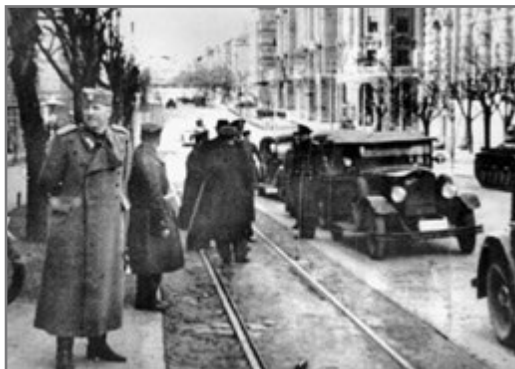
Bild 59: Rista Marjanović: Jugoslawische Militärs in der Knez Miloš-Straße (März 1941)

tere wurde 1938 gegründet und zeichnete sich durch ihre beeindruckenden Bilder aus, die den allerhöchsten Standard im britischen Fotojournalismus der damaligen Zeit repräsentierten (Briggs & Burke 2009, 193 f.).