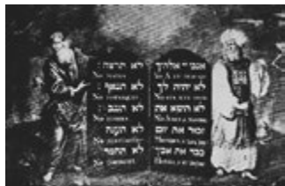
Bild 10: Aaron de Chaves: Die Zehn Gebote, Bevis-Marks-Synagoge, London (1675)

rierte sie. Die Buchmaler galten jedoch im Vergleich zu den hoch angesehenen Schreibern als untergeordnete Handwerker, deren Namen nur selten festgehalten wurde. Dekorationen und Illustrationen wurden ausschließlich für den privaten Bibelgebrauch angefertigt. Die heiligen Schriften für den Synagogengebrauch – sie wurden ausschließlich in Form von Schriftrollen verwendet – blieben jedoch weiterhin ohne Dekoration. Die Schönheit der Gesetzesrollen machte ausschließlich die kunstvolle Schrift aus (Magall 2005, 217–225; Lenhart 2009, 49).