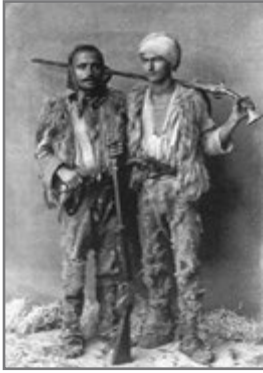
Bild 40: Bewaffnete Männer aus der Gegend um Shala: Kel Marubi (zw. 1900 und 1919)

interessieren. 1857 publizierte er ein Album mit 23 Kautypen über die Insel. 1869 fotografierte er die Taufe des zweiten Sohns des griechischen Königs Georg I.; anschließend wurde er zum Hoffotografen ernannt. Einige Jahre später ließ er sich in Lavrio (Attika) nieder und eröffnete dort ein Studio, in dem auch sein Sohn arbeitete (ebd., 65 f.).