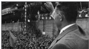
Bild 74: Nicolae Ceaușescu (1965)