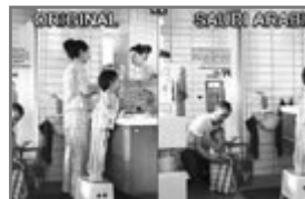
Bild 79: Ein internationaler Möbelkonzern passt seinen Katalog saudischen visuellen Konventionen an

bung zu 93 Prozent nur dann gezeigt, wenn das Produkt eindeutig der weiblichen Sphäre zuzuordnen ist – beispielsweise Schönheit oder Haushalt –, während in den USA dieser Prozentsatz nur 39 Prozent ausmacht (Al-Olayan & Karande 2000, 70).