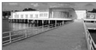
Bild 64: Atatürks Sommerresidenz in Florya, Istanbul – ein paradigmatisches modernistisches Gebäude (1934/36)