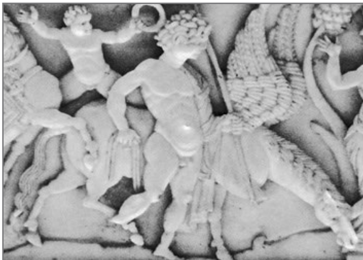
Bild 27: Ausschnitt aus dem sogenannten Veroli-Kästchen (Anfang 11. Jh.)

Künstler oder Handwerker modellierte dessen Oberfläche ausgemacht körperbetont, in lebhaften Bewegungen und in einem Realismus, der keine Parallelen zur Ikonenmalerei hat. Dieser Dualismus zwischen wirklichkeitsgetreuer profaner ( živopis ) und traditionsgebundener geistlicher Malerei ( ikonopis ) in slawischen Sprachen verweist auf eine Tradition der profanen Malerei bzw. des profanen Kunstschaffens, wenngleich diese nicht in jeder Phase der historischen Entwicklung – speziell auf dem Balkan – eine Rolle spielte. In Russland hingegen stellte die Vollplastik seit der Reform des Kunstbetriebes durch Peter den Großen im frühen 18. Jahrhundert kein Tabu mehr dar (ebd., Anm. 11).