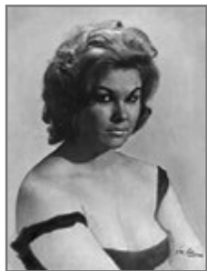
Bild 24: Purlanty Abdel Hamid, ägyptischer Filmstar: Van Leo 1962

und mit Sonnenhut auf. Am 12. Jänner 1915 fand im Athenener Filmtheater „Pantheon“ die Premiere des ersten griechischen Spielfilms statt: Golfo – ein abendfüllender, 1.700 Meter langer Streifen. Die Produktion des Films wurde von einem aus Smyrna/Izmir stammenden Unternehmer finanziert (ebd., 36–43).