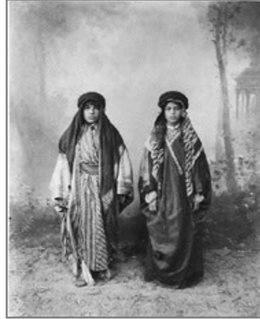
Bild 52: Mittelschüler in Diyarbakir, Studio Sebah & Joaillier (zw. 1888 und 1893), Abdülhamid-Album