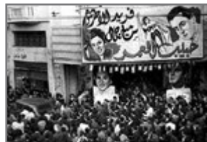
Bild 69: Beirut: Premiere des Films Die Liebe meines Lebens 1947

Fernsehproduktionen reduziert. In Kuwait wurden Ende der 1970er-Jahre die ersten beiden abendfüllenden Filme produziert, einer davon in Koproduktion mit dem Sudan; in Bahrain begann die Filmproduktion 1989. Jordanien hat kaum etwas mehr als ein halbes Dutzend Spielfilme hervorgebracht, der Irak etwa 100, Syrien etwa 150, der Libanon allein in den 1950er- und 1960er-Jahren etwa 180. Ägypten hingegen hat bislang über 2.500 Filme nur für das Kino produziert (Shafik 2007, 9).