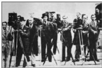
Bild 60: Griechische Kameraleute vor dem Denkmal des Unbekannten Soldaten in Athen (1928)

ter ins Leben, als die ersten zwei Zeitungen mit Fotojournalisten in der Redaktion gegründet wurden (Micklewright 2005, 636).