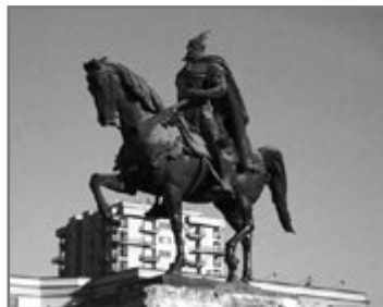
Bild 19: Reiterdenkmal Skanderbegs in Tirana (1968)