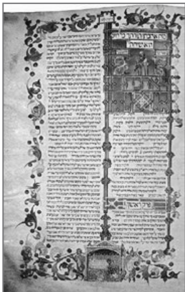
Bild 7: Mischneh-Thora von Maimonides, kopiert in Spanien (14. Jh.); illuminiert in Perugia (ca. 1400)