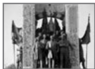
Bild 62: Reliefplastik in Istanbul, Taksim-Platz (1928 enthüllt)