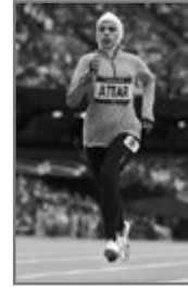
Bild 80: Die Läuferin Sarah Attar ist eine der ersten saudischen Athletinnen bei Olympischen Spielen (London 2012)