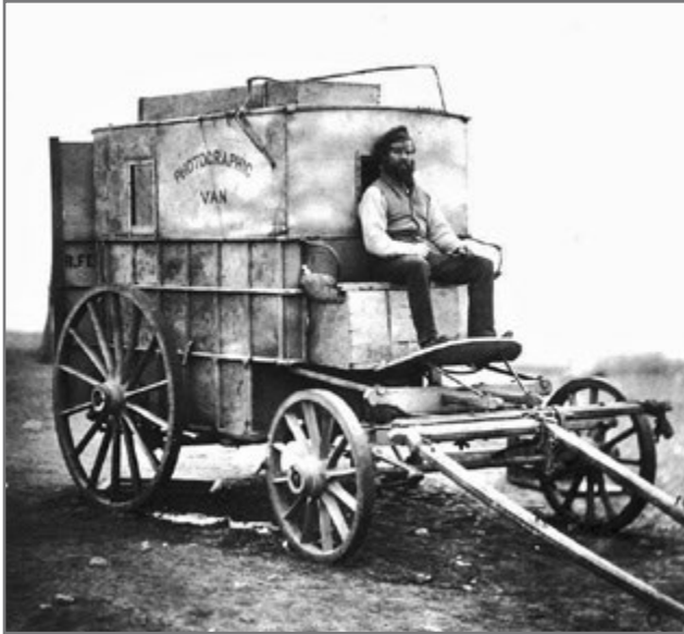
Bild 46: Roger Fenton mit seiner mobilen Dunkelkammer während des Krimkrieges (1855)

Für orientalisierende Bilder war die Kalotypie besser als jede der bis dahin bekannten Techniken geeignet. Fotografen wie Roger Fenton (1819–1869) erkannten dies und richteten Studios für Genreszenen ein. Der bekannte Krimkriegsfotograf produzierte 1858 in seinem Londoner Studio die orientalische Fotoserie „Orientalist Suite“. In 51 Fotos stellte er Szenen des „orientalischen“ Privatlebens fantasievoll nach, die er 1860 in London ausstellte. Diese Studiofotos wurden für Fotografen im Nahen Osten beispielgebend, die nun auch begannen, Genres zu inszenieren. Beliebte Motive waren „der Wasserträger“, „die Tänzerin“, „der Musiker“, der „Barbier“ oder „der Verkäufer“. Der Unterschied zur westlichen industriellen Welt musste deutlich zum Ausdruck kommen (Perez 1988, 100–119; Vavpotić 2008, 79–88). Daraus lässt sich schließen, dass eine bestimmte Methode und bestimmte Genres des Orientbilds vom Westen in den Nahen Osten transferiert wurden, um von dort als „genuine“ Aufnahmen an westliche Touristen und Touristinnen verkauft zu werden.