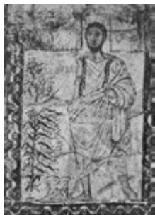
Bild 6: Dura-Europos-Synagoge, Ausschnitt aus den Fresken: Moses und der brennende Dornbusch (Mitte 3. Jh. n. Chr.)

Das umfassende Bilderverbot dauerte offenbar nur so lange, wie Götzenverehrung eine ernsthafte Bedrohung des monotheistischen Judentums darstellte. Ein Traktat in der Mischna aus der Zeit um 200 n. Chr. verdeutlicht, dass das Bilderverbot gegen die Götzenverehrung gerichtet war. Demnach dürfe alles außer Gott dargestellt werden; darüber hinaus war das Herstellen von Skulpturen und Hochreliefs verboten (Lenhart 2009, 18). Ab dem 3. Jahrhundert n. Chr. waren einzelne Rabbis der Meinung, die Götzenverehrung sei unter den Juden gebannt und figurative Kunst etwa für Lehrzwecke zuzulassen (Mann 2000, 18f.). Die Diasporagemeinden waren wesentlich konservativer als das Heimatland und vermieden die Darstellung von Mensch und Tier. Die wichtigste Ausnahme hinsichtlich figürlicher Darstellungen in der Diaspora stellt die Dura-Europos-Synagoge aus dem 3. Jahrhundert n. Chr. im heutigen Syrien dar. Ihre Wände sind vom Boden bis zur Decke mit Fresken biblischer Inhalte bedeckt. Dieses Beispiel zeigt, dass es Juden unter bestimmten Bedingungen durchaus möglich war, figürliche Kunstwerke herzustellen; die Frage für die liberale Periode ist daher eher, ob und wie sie diese Möglichkeiten nutzten (Avi Jonah 1972, 38–42; Landsberger 1973, 3–6; Lippold 1993, 43–51).