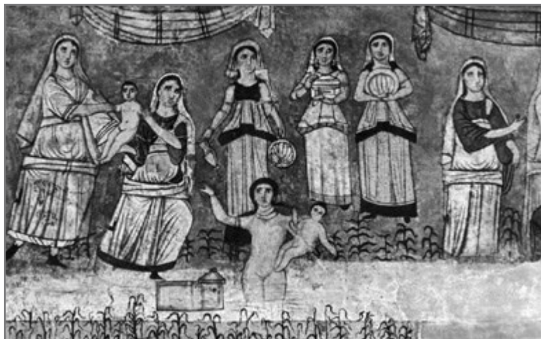
Bild 5: Dura-Europos-Synagoge, Ausschnitt aus den Fresken: Die Tochter des Pharao den kleinen Moses auffischend (Mitte 3. Jh. n. Chr.)

die Statue eines menschlichen Wesens in der wichtigen Synagoge von Nehardea, einem Zentrum jüdischer Gelehrsamkeit während des zweiten Babylonischen Exils am unteren Euphrat, gegeben hätte (Oppenheimer 2008, 65).