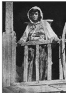
Bild 44: Hugo Bernatzik: „Albanische Gebirgsbäuerin dinarisch-alpiner Rassenmischung aus der Gegend von Shingjon. Typisch ist die uralte Fransenfrisur“ (1929)