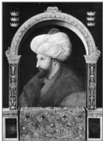
Bild 15: Gentile Bellini: Porträt Mohammeds II. des Eroberers (1480)

Der erste war wohl Mehmed II. (1444–1446, 1451–1481), der Eroberer Konstantinopels im Jahr 1453. Er schätzte die italienische Renaissancemalerei und ließ sich im Jahr 1480 vom venezianischen Maler Gentile Bellini (ca. 1429–1507) porträtieren. Das Porträt wurde der Öffentlichkeit nicht zugänglich gemacht (heute ist es in der Londoner National Gallery zu bewundern). Einzelne osmanische Künstler setzten diese Tradition fort. Ganze Porträtserien des Herrscherhauses entstanden. Selim II. (1566–1574) ließ sich gar mit