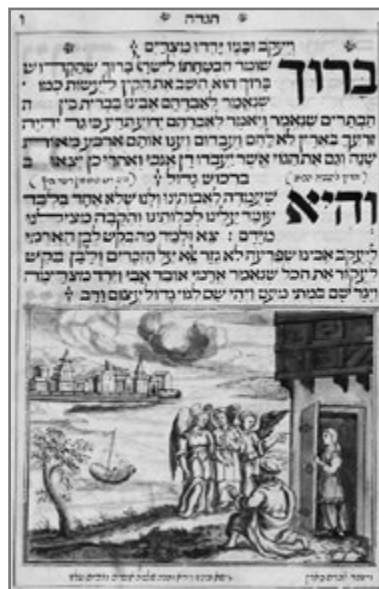
Bild 9: Hamburg-Haggadah: Kanaan: Abraham empfängt drei mysteriöse Gäste, während sich Sarah versteckt (Yaakov ben Yehuda Leyb 1731)