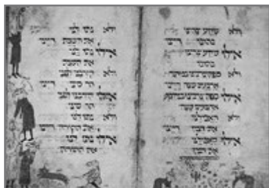
Bild 8: Vogelkopf-Haggadah: li: Moses nimmt die Gesetzestafeln entgegen; re: Manna und Wachteln fallen vom Himmel (Süddeutschland 13. Jh.)

Noch nicht thematisiert wurde die Tradition der Buchmalerei, die viel älter als die islamische ist. Sie geht wahrscheinlich bis in die römische Zeit zurück, als, wie bereits erwähnt, die Gefahr der Götzenanbetung von den rabbinischen Behörden offenkundig bereits als gebannt erachtet wurde. Die ältesten bekannt gewordenen Werke jedoch stammen aus der arabischen Welt – aus dem 9./10. Jahrhundert. In Europa ist die jüdische Buchmalerei erst aus dem frühen 13. Jahrhundert (Spanien, Frankreich, Deutschland) bekannt. Aus Frankreich (1394) und Spanien (1492) wurden die Juden und Jüdinnen ausgewiesen, und dadurch endete hier diese Tradition; in Deutschland und Italien wurde sie nach ihrem Aufkommen durch den Holzschnitt ersetzt. Ein Großteil der Dekorationen und Illustrationen hebräischer Handschriften dürfte das Werk jüdischer Künstler gewesen sein. Der Maler illustrierte den Text nach den Anweisungen des Schreibers; ein Lehrling kolo-