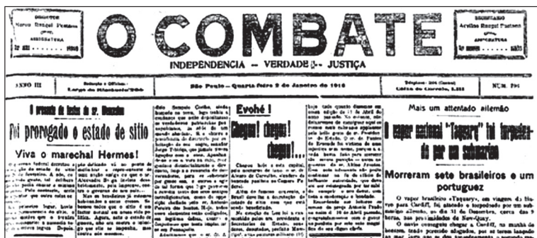
Figura 12 – Gêneros presos de O combate .

Na página inicial, e com posição de destaque, eram publicados textos cujo conteúdo pautava-se na opinião do jornal sobre os últimos acontecimentos do cenário político nacional ou sobre algum fato importante para a vida socioeconômica brasileira. Nesses textos, ficava patente o posicionamento ideológico dos redatores frente aos assuntos em pauta, uma vez que era adotada uma postura de denúncia das irregularidades da vida pública e de defesa dos ideais das classes menos favorecidas. Esses textos podem ser denominados editoriais , uma vez que tinham o propósito de exprimir o parecer do jornal em relação a determinado acontecimento por meio de um teor dissertativo/opinativo. Entretanto, considerar que um único jornal tenha mais de um editorial pode causar um certo estranhamento caso não se leve em conta o período jornalístico em questão, que se caracterizava pela formação do padrão a ser seguido por esse hipergênero – nesse sentido, alguns textos de O alfinete , O Kosmos e O clarim d'alvorada também podem ser considerados editoriais , devido a seu caráter acentuadamente persuasivo.