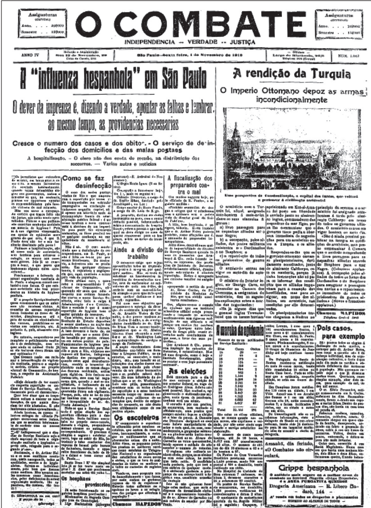
Figura 5 – O combate.

Fanfulla, O diário popular, A gazeta, A plateia, A capital, Il piccolo, O Estado de S. Paulo, A nação, diário espanhol, Germânia e O combate – nas reuniões que ocorriam na redação de O Estado de S. Paulo e na assinatura da carta em que consistiu o “Apelo dos jornalistas”.