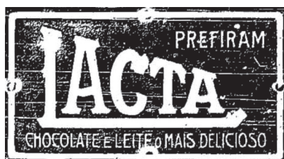
Figura 19 – Exemplo de propaganda em O combate .