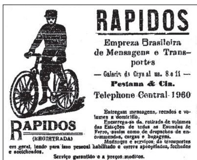
Figura 18 – Exemplo de propaganda em O combate .